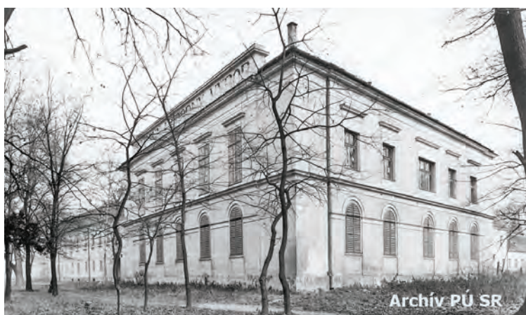
Za veľkými oknami na poschodí kaštieľa bola zasadacia sieň ONV, na atike fasády vidno veľký nápis Okresný národný výbor. Foto: Archív PÚ SR Bratislava, 1960

produktov pre štát. Ak ich roľníci neplnili, tak dostávali vysoké pokuty. Tu sa v rámci tzv. kolektivizácie plánoval vznik jednotných roľníckych družstiev (JRD). Samostatne hospodáriacich roľníkov tu nútili vstúpiť do JRD a tých čo nechceli vstúpiť, väznili v pivnici kaštieľa. Tu sa konali ľudové sudy, kde vyniesli rozsudky, ktorými poslali ľudí do väzenia na základe vykonštruovaných obvinení.