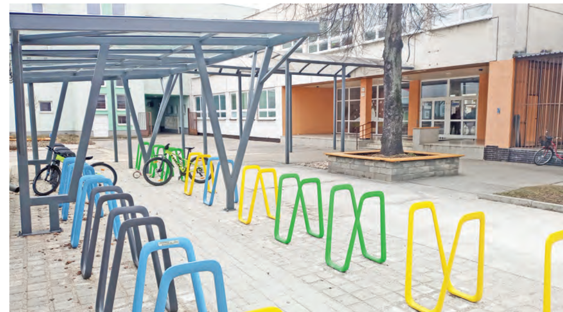
Polokrytý prístrešok poskytne bezpečné odloženie a uzamknutie pre 60 kusov bicyklov a kolobežiek.

dôležitého a neodkladného oznámenia vo verejnom záujme sa tento oznam odvysielal i mimo pravidelného vysielačieho času. (red)