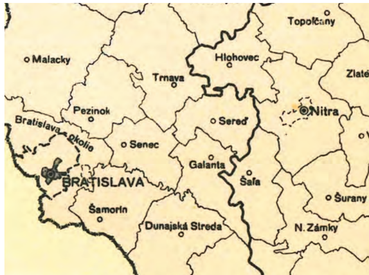
Detail mapy: Československá republika, Administratívne a územné rozdelenie, 1957

ONV a kaštieľ v Seredi sa v 50. rokoch 20. storočia tragicky zapísali do života a osudov mnohých rodín z obcí Seredského okresu. Odtiaľto smerovali k ľuďom rôzne nariadenia, výmery a príkazy, ktorými prišli ľudia o svoje živnosti, nehnuteľnosti a hnutelný majetok. Tu predpisovali roľníkom neprímerane vysoké kontingenty – povinné dodávky potravinárskych