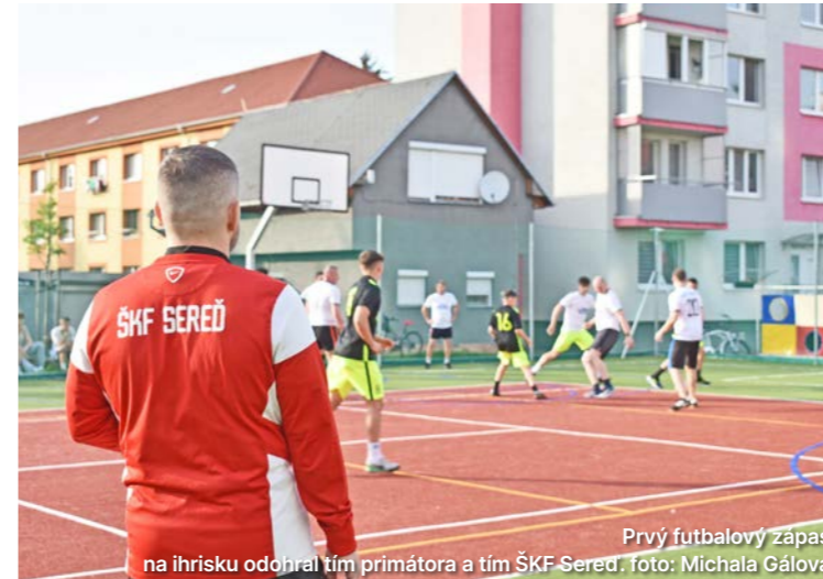
Prvý futbalový zápas na ihrisku odohral tím primátora a tím ŠKF Sereď.

Oficiálne otvorenie športovísk sa uskutočnilo počas Športového štvrtka na Spádovej ulici. Červenú