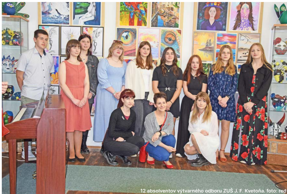
12 absolventov výtvarného odboru ZUŠ J. F. Kvetoňa.

Slávnostná vernisáž výstavy sa konala v piatok 12. apríla v mestskom múzeu. So svojimi výtvarnými prácami sa predstavilo 12 absolventov a 30 žiakov. Vystavené diela sú charakteristické svojou rôznorodosťou a bohatstvom výtvarných prác, ktoré ponúkajú pohľad na svet okolo nás cez oči mladých umelcov. Od stvárnených krajín a portrétov až po abstraktné diela, každá práca nesie so sebou hlboké prepojenie s každodenným životom, s vecami, predstavami a pocitmi, ktoré nás formujú. Približne 100 vystavených obrazov je realizovaných v rôznych technikách ako kresba, maľba, grafika, modelovanie či iné dekoratívne činnosti. Témy, ktoré sa v ich dielach objavujú, sú rozmanité – od krajín a portrétov cez prírodné motívy a študijné kresby až po abstraktné výtvary a práce s presahom na divadelnú tvorbu. Výstava potrvá do 10. mája 2024.