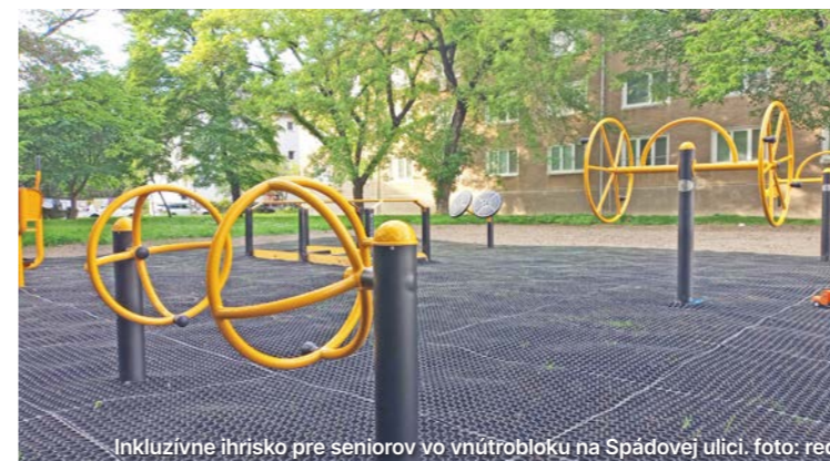
Inkluzívne ihrisko pre seniorov vo vnútrobloku na Spádovej ulici.