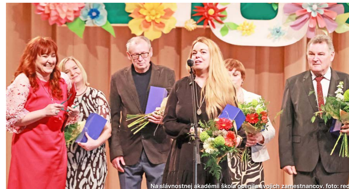
Na slávnostnej akadémii škola oceníla svojich zamestnancov.

Škola, ktorá nesie meno významného slovenského spisovateľa a pedagóga Juraja Fándlyho tento rok oslavuje 40. výročie založenia (Juraj Fándly bol najaktívnejší z bernolákovskej skupiny, osvietenecy spisovateľ a rímskokatolícky kňaz, ktorý ako kaplán pôsobil v Seredi). Tento dôležitý míľnik si zaslúži veľkú pozornosť a spomienku na roky práce, vzdelávania a formovania mladých ľudí. Od svojho založenia sa neustále rozvíjala a prispôbovala sa potrebám moderného vzdelávania. Vďaka oddanosti svojich pedagógov, podpore rodičov a angažovanosti žiakov sa škola stala symbolom kvalitného vzdelávania a osobnostného rozvoja. Pri príležitosti jubilea zorganizovala škola dňa 11. apríla 2024 veľkolepú oslavu. V tento deň otvorila svoje brány a pozvala bývalých i súčasných pedagógov, zamestnancov školy, absolventov ako aj zástupcov MŠVVaM SR, Regionálneho úradu školskej správy v Trnave, Regionálneho centra podpory učiteľov v Galante, zástupcov mesta Sered a pedagógov z okolitých škôl. Prítomní hostia úvodom absolvovali prehliadku priestorov školy, počas ktorej mali možnosť nahliadnuť do tried, učebni i kabinetov a spoznať